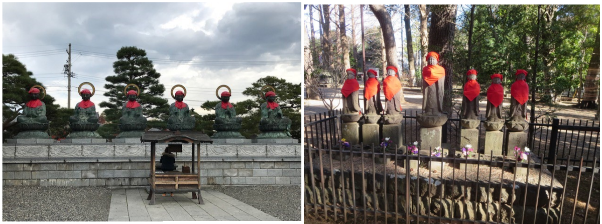
左) 長野善光寺の六道地蔵尊： 天道、人間道、修羅道、畜生道、餓鬼道、地獄道 右) 狛江泉龍寺の六道地蔵大菩薩： 天道、人間道、修羅道、寄進者、地獄道、餓鬼道、畜生道 私見) 天道、修羅道、人間道、畜生道、餓鬼道、地獄道

ぼくにも罪業が少しもないなどとは言えない。生きてきた中で自ら認識していなくても、それなりに他者を傷つけたこともあるだろう。従って、天道には転生できず、と言って人間道には転生したくはなく、もう一度、阿修羅道に転生する前に一休みして、天道の門近くの道端に咲く草花になり、天国に行く人たちを拍手で迎えたい。『はてしない物語』（エンデ 1979）は子供たちの誰かに読み継がれなければならない。そうした子供がいなくなれば、ホモ・サピエンス人間の物語はすでに終わっているのだ。