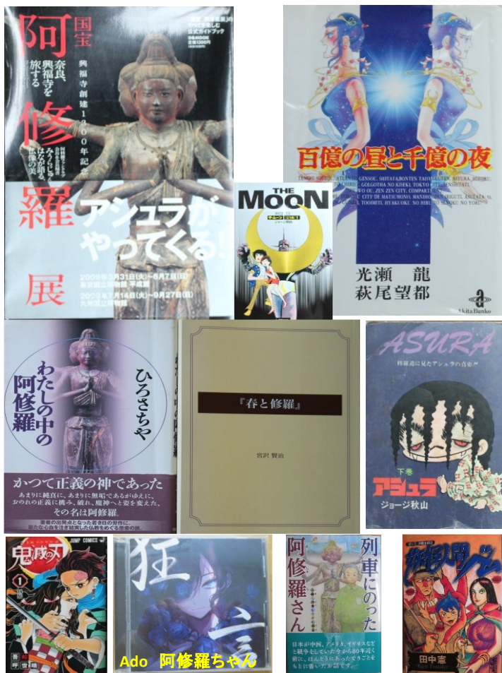
図 1. 阿修羅に関連した作品

ここに出てくる鬼たちは飢餓によってだけではなく、強くなり人間や鬼を支配する権力を得るために人間を楽しみで沢山喰うのである。彼らは思い違えた家族への心に飢えており、それを権力で置き換えていたのである。鬼より恐ろしいのは人間の心の闇に深く潜み澱む毒である。毒を溜め込んだ人間は残念なことに実在している。鬼は見た目が怖く。毒人間は見た目ではわからない。鬼は人間の心の闇の中に隠れ住んでいる。恐ろしいのは鬼よりも人間だ。何故なら、鬼の姿は見るからに恐ろしいが、人間の姿は神に似せてあり、一見では優しいか恐ろしいかはわからない。